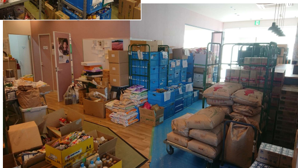
フードバンクちば事務所の様子

ご寄付いただいた食品は、フードバンクちばで賞味期限別、商品分類別に保管し生活困窮者等へ提供しています。